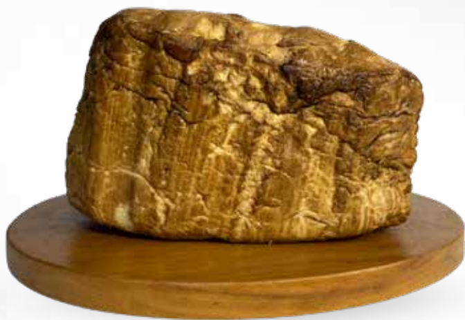
Queso Ahumado Molde 2 kg