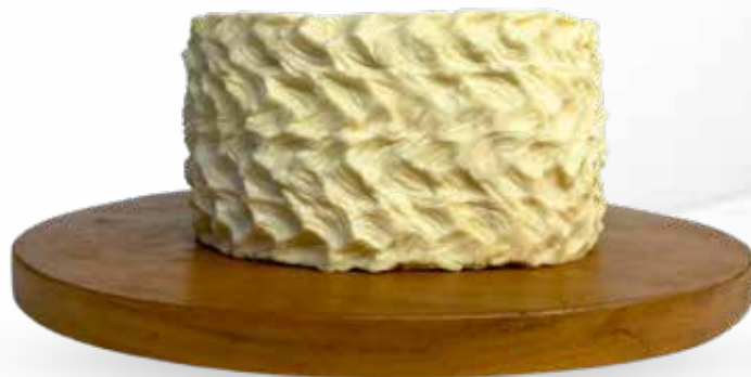
Queso Paria Molde 1.2 kg