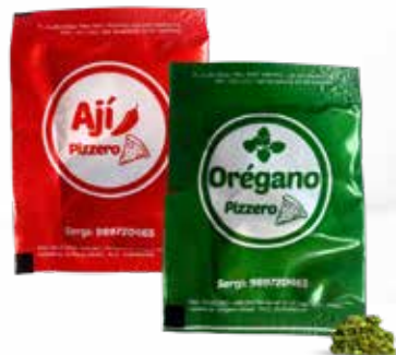
Orégano y Ají PIZZERO