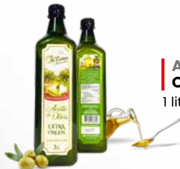
Aceite de oliva OLIZANA