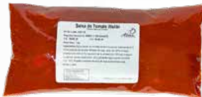
Salsa de tomate WALIBI