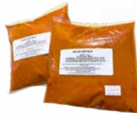
Salsa Búfalo TRESA