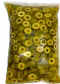
Aceitunas Verdes en rodajas