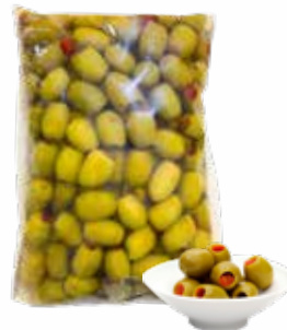
Aceitunas Verdes con pimiento