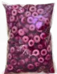
Aceitunas Negras en rodajas