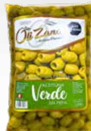
Aceitunas Verdes Sin pepas