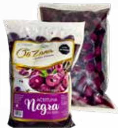
Aceitunas Negras sin pepa