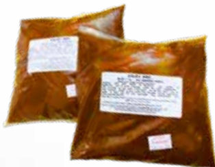
Salsa BBQ Normal/picante TRESA