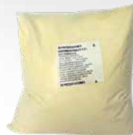
Ajo en polvo