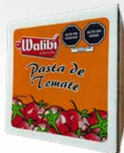
Pasta de tomate WALIBI