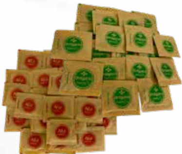
Orégano y Ají PIZZERO